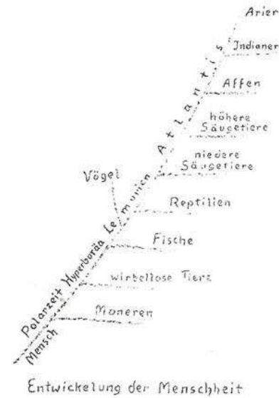
Links: Fig. 1 Evolutiemodel Hermann Poppelbaum